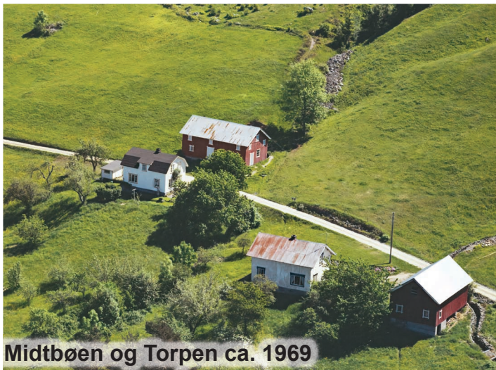
Midtbøen og Torpen ca. 1969